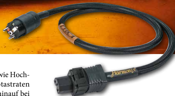
Dieses hochwertige, phasenmarkierte Harmonix-Netzka- bel ist im Kaufpreis enthalten

der selbstbewusste Japaner (siehe Statement) den größeren Sinn darin, deren Format von 16 Bit/44,1 kHz zu klanglichen Höhenflügen zu verhelfen.